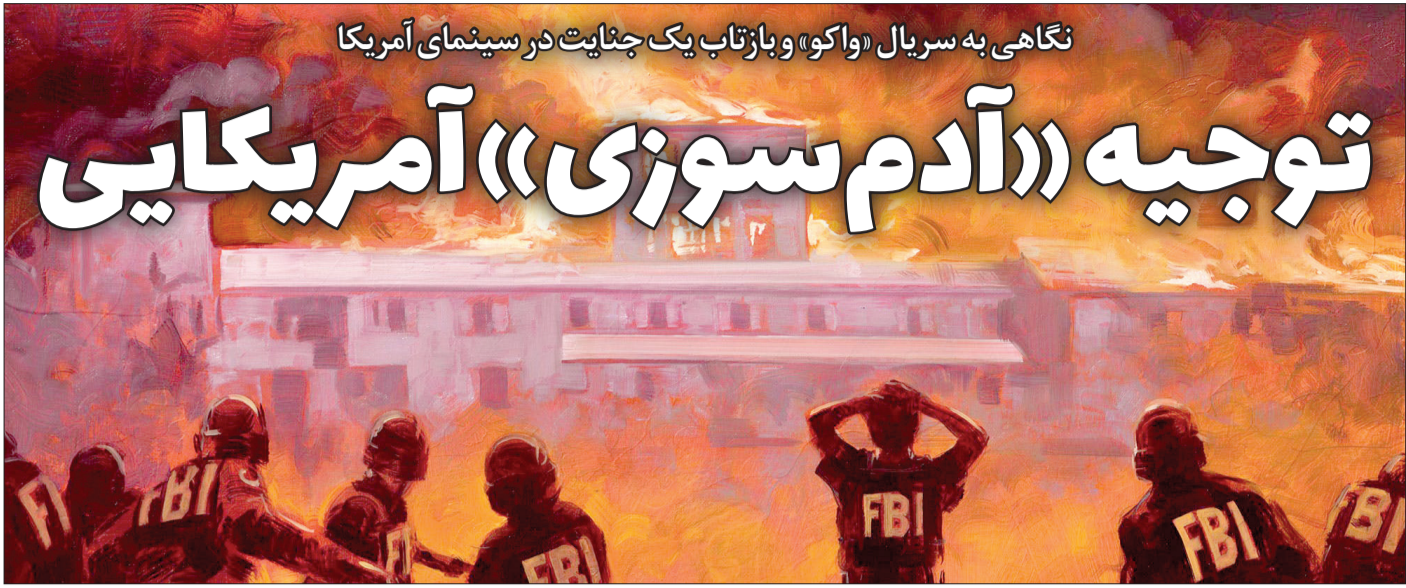
نگاهی به سریال «واکو» و بازتاب یک جنایت در سینمای آمریکا

آدوینیسیم شاخه‌ای از مذهب پروتستان است که در قرن نوزدهم ظهور کرد و آن را به «بیداری بزرگ دوم» تعبیر می‌کنند. ویلیام میلر که کشاورزی انگلیسی بود، در ۱۸۳۰ فرقه‌ای را پایه‌گذاری کرد که مبنای آن آخرالزمانی بود و به ظهور دوم مسیح اعتقاد داشت. این فرقه، زمان این ظهور را ۱۸۴۳ تعیین کرد که طبعاً چنین اتفاقی نیفتاد و پس از آن انشعابات متعددی در آدوینیسیم به وجود آمد. یکی از این فرقه‌ها در ۱۹۳۰ توسط ویکتور هانتف که مهاجری بلغاری به آمریکا و یک معلم مدرسه بود، ایجاد شد. او کلیسای هفتادروزه را تأسیس کرد و در ۱۹۵۹ بن رودن روی چنین باوری، بنای فرقه دیویدیه را گذاشت. گروه رودن سرانجام به مزرعه‌ای در نزدیکی منطقه‌ای به نام واوکو در تگزاس نقل مکان کردند. آنها