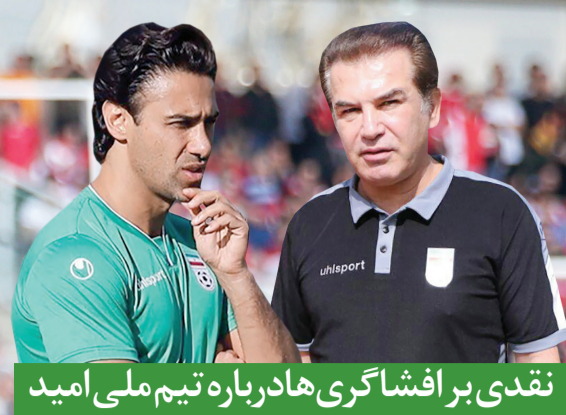
نقدی بر افشاگری هادرباره تیم ملی امید