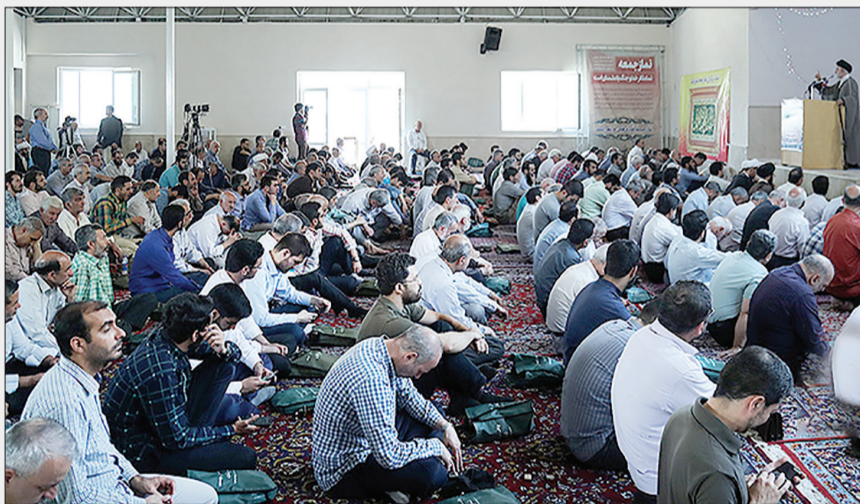
نماز جمعه دیروز لوسان با حضور جمعی از عدالتخواهان | مهدی افراخته | SNN