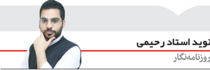
نوید استاد رحیمی