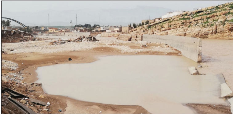
احداث دیواره بتنی در بستر رودخانه و محدود کردن عرض عبور جریان