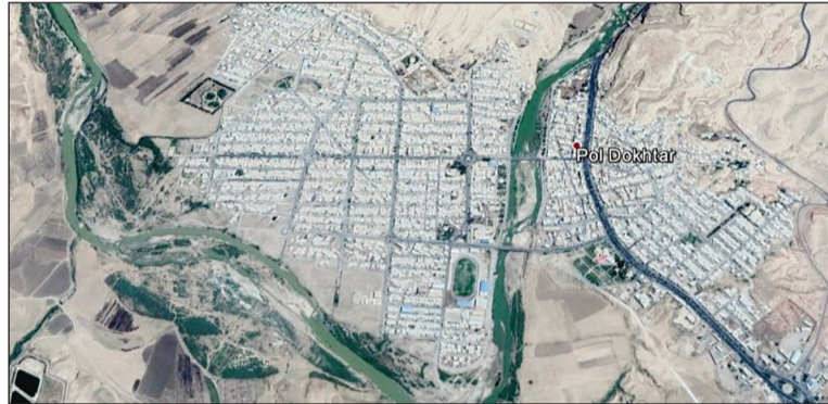
تصویر ماهواره ای رودخانه کشکان در بازه عبوری از شهر پلدختر

عضو هیات علمی واحد تهران شرق با حضور میدانی در مناطق سیل زده علت های علمی وقوع سیل را بررسی کرده است