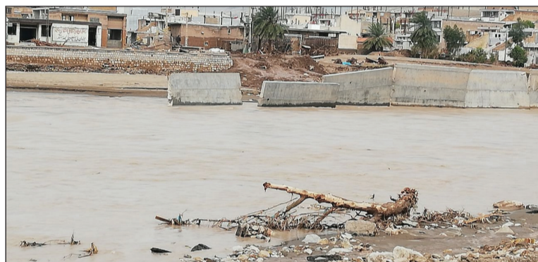
شکست دیواره های حفاظتی کناره رودخانه و ورود پر قدرت جریان به مناطق شهری