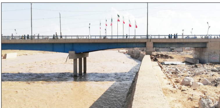
انسداد غیر مهندسی دهانه پل در اثر احداث سازه حفاظتی در کناره رودخانه