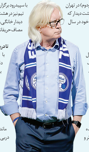
تادربی جان سالم به در می‌برند؟

تادربی جان سالم به در می‌برند؟ با اتمام برنامه‌های آسیایی و داخلی ملی‌پوشان دو تیم برای برگزاری تمرینات و اردوی تیم ملی در فیفادی فروردین‌ماه به تیم ملی می‌رسند و همین موضوع کار این تعداد را به مراتب برای برگزاری دربی امروزر در تهران با استقلال خوزستان دیدار می‌کنند و سپس دوشنبه آینده در جام حذفی در آزادی میزبان پدیده خواهند بود. سرخابی‌ها در ادامه لیگ برتر و