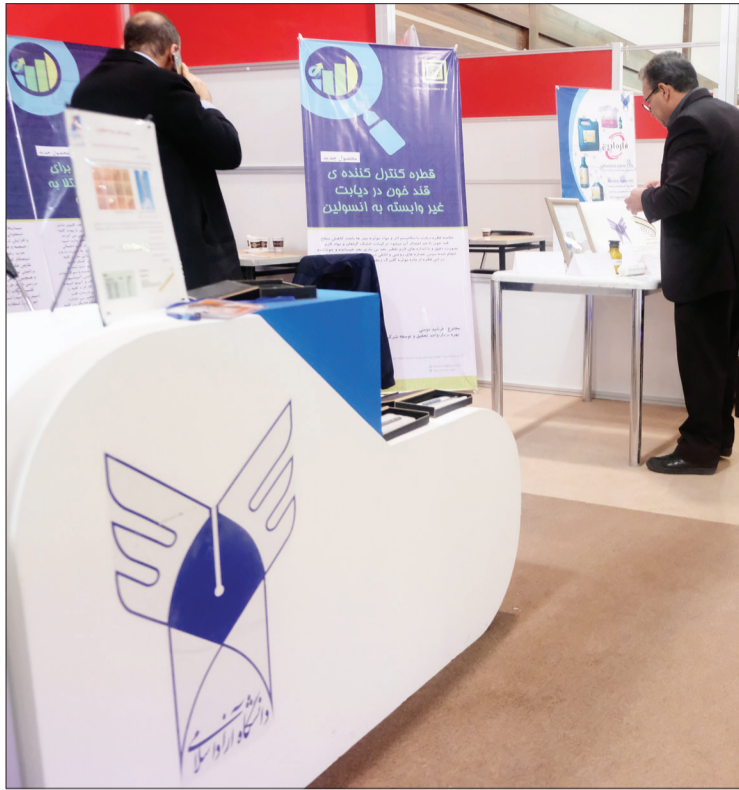
نخستین نمایشگاه فن بازار تجهیزات پزشکی دانشگاه آزاد اسلامی