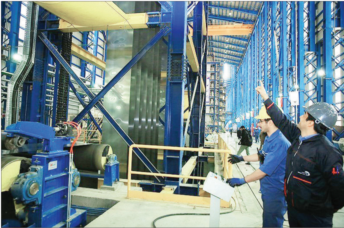
رتبه جهانی ایران در فضای کسب و کار طی ۱۵ سال اخیر