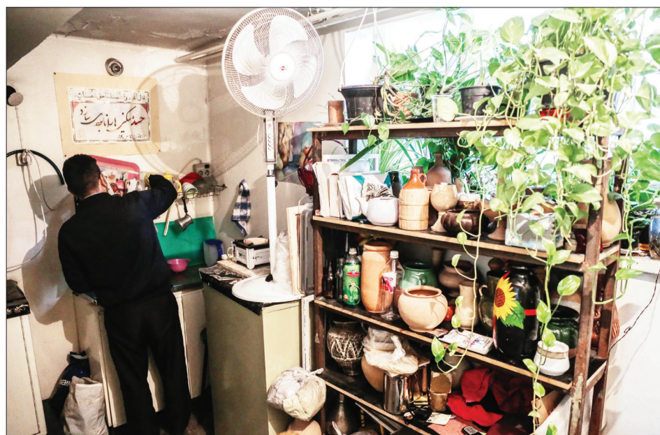
آیدارخانه گروه طراحی صنعتی دانشکده هنرهای زیبای دانشگاه تهران