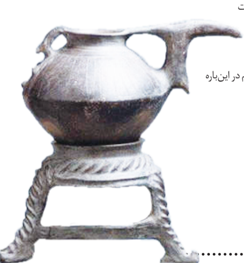
دیگچه دهان لوله‌ای سه پایه ۱۲ هزار سال قبل (عصر آهن) تپه حسن لو آذربایجان موزه مترو پولیتن نیویورک

اگر آمریکایی‌ها و فرانسوی‌ها برای غارت اشیای عتیقه ایران، حکومت‌های وقت این کشور را مجبور به امضای قراردادهای ننگین کردند، انگلیسی‌ها حتی یک قرارداد ساده هم در این باره