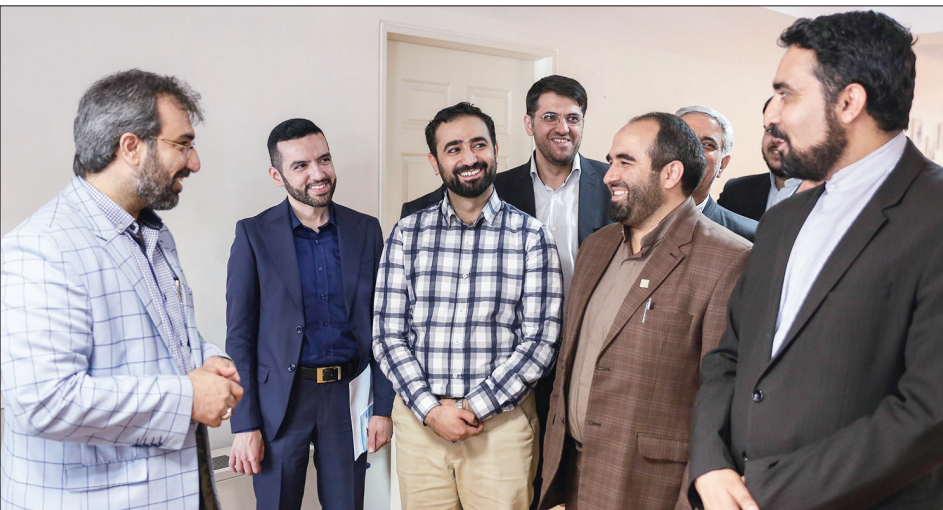
بازدید مسئولان بسیج اساتید دانشگاه آزاد اسلامی از روزنامه «فرهیختگان»