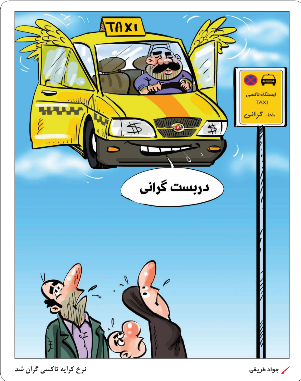
نرخ کرایه تاکسی گران شد