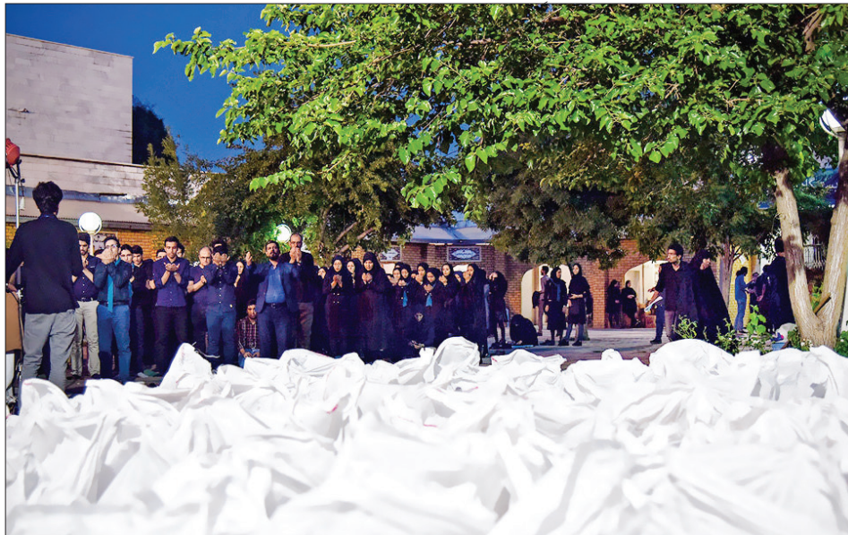
تأمین نیازهای غذایی حیاتی خانواده‌های محروم در ماه مبارک رمضان به همت جمعی از دانشجویان