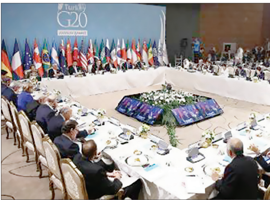
نشست جی ۲۰

هر چند این نشست با محوریت آب و هوایی برگزار شد، اما به دلیل انتظار ۶ ماهه رسانه‌ها برای دیدار ترامپ و پوتین، این موضوع از اهمیت بیشتری