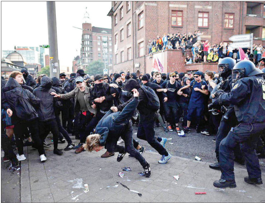
اعتراضات ضد سرمایه داری هامبورگ آلمان

به آلمان از روسای جمهور روسیه و چین به شدت انتقاد کرده است.