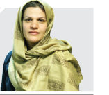
مهریانو ابجدی دوست خبرنگار فرهنگ و هنر

ساخت فیلم مستند همواره با فشار و نشیب‌های زیادی برای هنرمندان همراه بوده است. بسیاری از مستندسازان به دلایل مشکلات