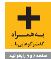
به همراه گفت‌وگوهای با... صفحه ۸ و ۹ و یازدهم