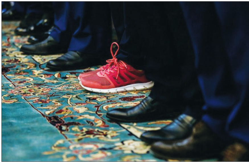
دختری با کفش‌های کتان

هنوز به ۲۰ سالگی نرسیده و تعداد مدال‌های بین‌المللی‌اش دورقمی است، از جمله ۶ مدال یکی از یکی خوش‌ترنگ‌تر. حتی کج سلیقتگی میزبانان کره‌ای‌ها در بازی‌های آسیایی اینچئون و ممانعت از حضور او به خاطر سن کمش هم نتوانست جلوی سیل اراده او را بگیرد. با کسب نخستین مدال بانوان ایرانی در المپیک همه جهان را به واکنش واداشت و چشم‌ها را به خود خیره کرد؛ دختر روزهای سخت. دختر دوست‌داشتنی ایران با آن اسکچرز رنگی دخترانه وسط جشن کفش‌های مردانه دولتی، خودش را شناخت و تصمیم گرفت از پیله‌اش