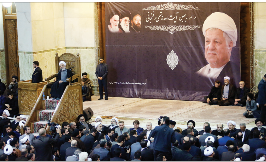
مراسم چهلمین روز درگذشت آیت‌الله هاشمی رفسنجانی

او ادامه داد: «اگر امروز از هاشمی و هاشمی‌ها تجلیل می‌شود و از امام(ره) سخن‌به‌یمن می‌آید به دلیل مسیر حیاتی است که به‌مانشان دادند. حوزه‌ا سیاست جدا نیست، روحانیت نباید به سال‌های قبل از مبارزه بازگردند، اگر حوزه‌می خواهیم انقلابی بماند باید مقابل اندیشه امام(ره) و هاشمی زانو بزنند. راه امام(ره) و هاشمی راه حوزه را مشخص می‌کند.»