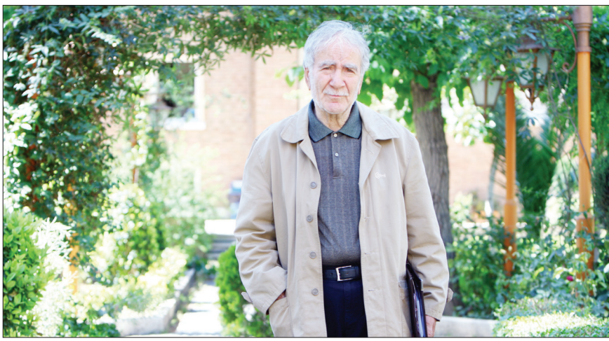
۵ دی ماه سالروز تولد غلامحسین ابراهیمی دینانی است

فلسفی در جهان اسلام» بهترین اثر او در این رابطه است. دینانی در قامت یک اندیشمند با مشخصه عقل‌گرا بودن شهرت دارد. او در تمام ساحت‌های دفاع از عقل را در اولویت قرار می‌دهد. او معتقد است: «تا عقل نباشد ادراکی پدید نمی‌آید.» او همه چیز را از زاویه دید عقل می‌نگرد؛ حتی عرفان را، از این رو کتابی می‌نویسد با عنوان «دفتر عقل و آیت عشق» که جایگاه عقل در حکمت و فلسفه را نشان می‌دهد. ابراهیمی دینانی از اولین افرادی است که در ایران هم تحصیلات بالای حوزوی دارد و هم تحصیلات بالای دانشگاهی، این ویژگی از او یک فرد مسلط در احاطه و تسلط به مباحث فلسفه اسلامی ساخته است.