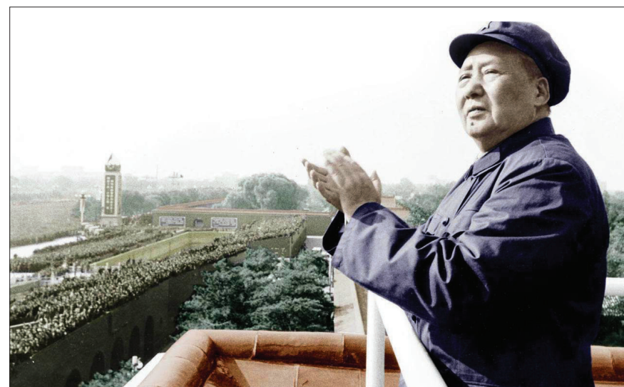
مائو تسه دونگ در سال‌های پایانی عمر

مائو امروز در چین همچنان به‌عنوان یک رهبر اسطوره‌ای شناخته می‌شود. مردی که سیاست‌های امروز چین نیز برگرفته از عقاید او دانسته می‌شود. مائو مردی بود که در طول زندگی دچار فراز و نشیب‌های فراوانی شد اما به راستی و مانند آنچه تایم گفته بود، هرگز هم غرق نشد. مائو در سال‌هایی که بر چین حکومت کرد، مسیب مرگ میلیون‌ها نفر شد اما یکی از بزرگ‌ترین خصوصیات او این بود که پس از مرگش نیز همچنان با همه کارهایی که کرد رهبری اسطوره‌ای باقی ماند.