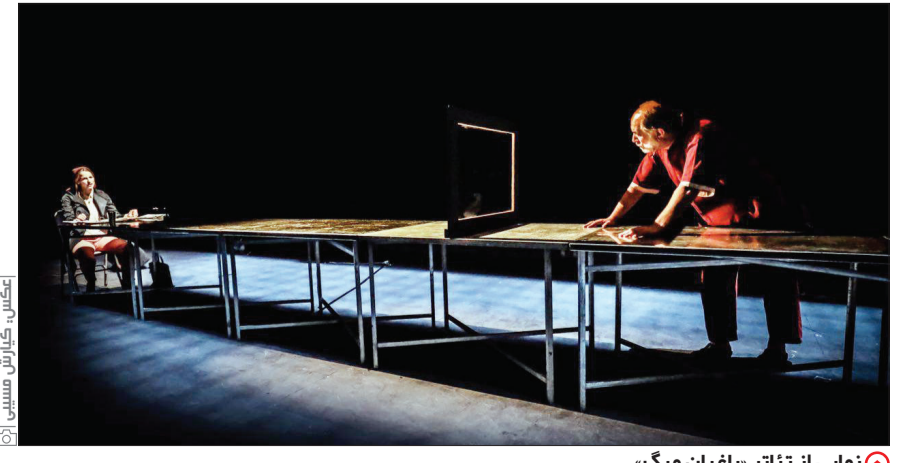
نمایی از تئاتر «باغبان مرگ»