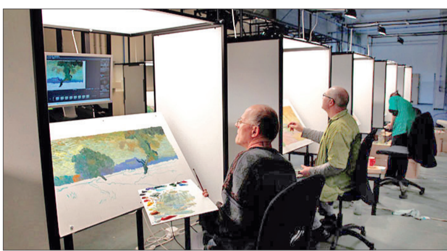
کارگاه انیمیشن «وینسنت دوست داشتی» در لهستان

گره تماشا وست اندرسون کارگردان مطرح سینمای فانتزی که آخرین فیلمش «هتل بزرگ بوداپست» محصول سال ۲۰۱۴ به چهار جایزه اسکار رسید و نقدهای ستایش آمیزی دریافت کرد؛ تصمیم گرفته که انیمیشنی به نام «جزیره سگ‌ها» را با صداپیشگی برایان کرانستن و ادوارد نورتن بسازد.