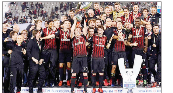
تیم فوتبال میلان پس از برد در سوپر جام ایتالیا

میلانی‌ها موفق شدند برابر برتری برابر یوونتوس در ضربات پنالتی، قهرمان سوپر جام ایتالیا شوند. در این رقابت که به ضربات پنالتی کشیده شد با وجود اینکه ابتدا جورجیو کیه‌لینی توانست یووه را به گل برساند، اما در نیمه دوم یونونتورا گل تساوی را برای میلانی‌ها به ثمر رساند تا کار به ضیافت پنالتی‌ها کشد؛ اتفاقی که خیلی‌ها مشتاقش بودند تا مصاف دو سنگربان کهنه کار و جوان را ببینند. یک طرف جیان لوییجی بوفون ۳۸ ساله و طرف مقابل جیان لوییجی دونا رومای ۱۸ ساله. و در نهایت این جی‌جی جوان و آینده‌دار بود که توانست با مهار ضربه حساس دیبالا، روسورنی را فاتح سوپر کاپ ایتالیا کند. به این ترتیب میلانی‌ها که مدت‌هاست از دوران عزت و افتخار خود فاصله گرفته‌اند، می‌توانستند در هوای مطبوع حاشیه خلیج فارس جام معتبری را بالای سر ببرند تا شاید هواداران پرشمارشان در ایتالیا و دیگر نقاط دنیا را کمی امیدوارتر نگه دارند. آدریانو گالیانی، نایب رئیس باشگاه میلان بعد از بازی در گفت‌وگویی که با سایت رسمی این باشگاه داشت، گفت: «بسیار خوشحالم و احساسی شده‌ام تا جایی که دوست دارم گریه کنم. آخرین قهرمانی‌ای که به دست آورده‌ایم به پنج سال پیش برمی‌گردد. این بیست و نهمین قهرمانی میلان با برلوسکونی است اما احساس می‌کنم که شیرین‌ترین آنها بوده است. دلیل اینکه چرا شیرین‌ترین قهرمانی برای میلان بوده رانیز در وقت دیگری برای شما خواهیم گفت.»