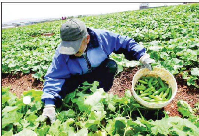
در سه سال گذشته با وجود خشکسالی، روند توسعه کشاورزی ایران مثبت بوده است

تولید محصول استراتژیک گندم در سال ۱۳۹۴-۱۳۹۳ با رشد ۹ درصد ثبت شد