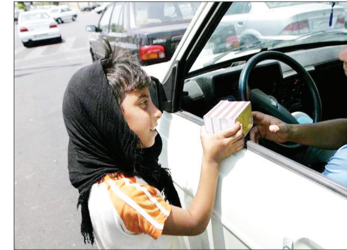
یک میلیون و ۴۰۰ هزار نفر در حاشیه مشهد زندگی می‌کنند

فرهیختگان | گرچه هنوز کانون سردفتران و دفتریاران به اجرای قانون ثبت هرگونه نقل و انتقال سند در دفاتر اسناد رسمی تأکید می‌کنند، اما راهنمایی و رانندگی همچنان بر سندیت برگسبزه‌های پلیس برای خودرو تأکید دارد. پلیس شناسی خیالش راحت شده که چند روز پیش عبدالرضا رحمانی فضلی، وزیر کشور نیز در اختلاف بین سردفتران و راهنمایان و رانندگی، طرف راهور را گرفت و گفت که برگسبزه‌های نیروی انتظامی برای نقل و انتقال خودرو کافی است. بر همین اساس بود که دیروز سعید روحی، معاون فنی و مهندسی پلیس راهور خطاب به سردفتران گفت: «توصیه اکید ما به دفاتر ثبت اسناد این است که از تنظیم سند وکالتی و قطعی بدون در دسترس داشتن تأییدیه پلیس خودداری کنند؛ چراکه ممکن است خودرو دوتکه، سرفتی یا دارای نواقص دیگر باشد که البته همین امر نیز نشان می‌دهد شرط کافی و اصلی برای شماره‌گذاری و نقل و انتقال خودرو همان برگ سبزی است که صادر می‌شود.» او افزود: «براساس ماده ۲۹ قانون رسیدگی به تخلفات رانندگی، متعاملین یعنی معامله‌کنندگان خودرو موظفند برای بررسی اصل خودرو و همچنین هویت طرفین معامله و دریافت پلاک جدید به مراکز تعویض پلاک مراجعه کنند.»