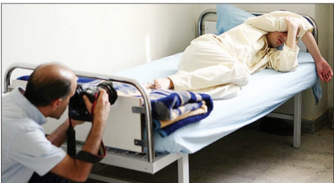
هزینه درمان بیماری‌های روانی در ایران بالاست

کافی است که به اطراف‌مان نگاهی بیندازیم. خواهیم دید افرادی با اختلال‌هایی چون افسردگی، استرس، وسواس و ... کم نیستند و شاید خود ما هم یکی از آنها باشیم. آمارهای وزارت بهداشت، نشان می‌دهد در حالی که