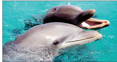
شناسایی شباهت‌هایی میان مکالمه دلفین و انسان