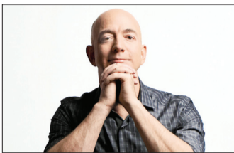
جف بنزوس، بنیانگذار و مدیر اجرایی آمازون

فرهیختگان| «جف بنزوس»، بنیانگذار و مدیر اجرایی آمازون و موسس شرکت آمریکایی Blue Origin، فعال در زمینه هوافضا، از نوعی موشک رونمایی کرده است که به گفته او رقیب موشک SpaceX ایلان ماسک خواهد بود. انتظار می‌رود پیش از پایان