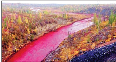
تخلیه موادشیمیایی عامل شدن رودخانه‌ای در سیبری

فرهیختگان| از قرمز شدن رودخانه‌ای در سیبری سرانجام فاش شد. کمپانی «نوریلسک نیکل»، بزرگ‌ترین تولیدکننده نیکل در جهان پذیرفت که سرریز شدن نیروگاه متالورژی این کمپانی مسئول تغییر رنگ این رودخانه محلی بوده است. به گزارش CNN، پنجم سپتامبر بعد از بارندگی شدید که در منطقه رخ داد، مواد نگهداری‌شده پشت دیواره این نیروگاه سرریز شد و با ریختن در رودخانه، باعث قرمز شدن آن شد. تغییر رنگ موقت این رودخانه با نمک‌های آهن خطری را متوجه افراد و جانوران رودخانه نمی‌کند. هفته گذشته ساکنان این منطقه با مشاهده تصاویر منتشرشده از این رودخانه با مقامات تماس گرفتند تا علت را جویا شوند. وزیر منابع طبیعی و محیط‌زیست روسیه در حال بررسی روی این موضوع هستند، اما شواهد بیشتر نشان می‌دهد که این رنگ قرمز به خاطر تخلیه موادشیمیایی از نیروگاه به درون آب بوده است. در نزدیکی «نوریلسک» معدن زیادی وجود دارد که این منطقه مقادیر بالایی نیکل، مس و پلادیوم دارد.