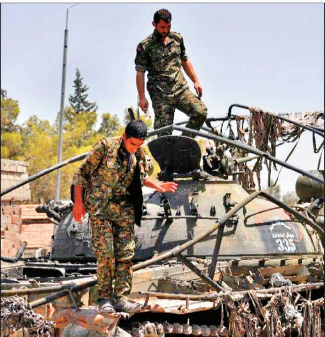
روسیه برای توقف درگیری در حسکه میان‌جیگری می‌کند

در نبرد سوریه نقش تعیین‌کننده‌ای ایفا کرده‌اند، گروهی که از متحدان اصلی ایالات متحده آمریکا و همچنین خاری نیست، طبیعتاً پای آمریکا و روسیه نیز به این نبرد باز خواهد شد، دو کشوری که در بحران سوریه برخی اوقات متحدند و گاه رقیب. مجموعه این عوامل به کنار، رویارویی در حسکه می‌تواند بر نبرد حلب نیز تأثیر منفی بگذارد، منطقه‌ای رهبری ایالات متحده آمریکا هستند و ارتش سوریه مورد حمایت روسیه، یگان مدافع خلق (YPG) طی دو سال گذشته