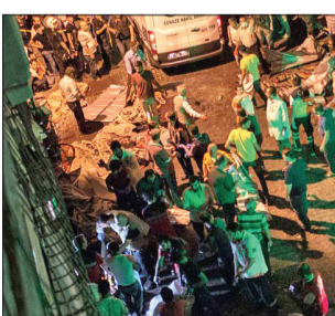
اردوغان داعش را مسئول حمله به جشن عروسی معرفی کرد

فهرست‌نگار| ترکیه بار دیگر هدف حمله تروریستی قرار گرفت. جمله‌ای که به عقیده اردوغان، رئیس‌جمهوری ترکیه توسط گروه تروریستی داعش هدایت و اجرا شده است. این بار شهر غازی انبج، منطقه‌ای واقع در جنوب ترکیه و در امتداد مرزهای سوریه هدف حمله قرار گرفت. آن گونه که ناظران می‌گویند، یک بمب‌گذار انتحاری، کسی که مواد منفجره را در کتس پنهان کرده بود به مراسم عروسی در آن منطقه برگزار شده بود آمده و خودش را منفجر می‌کند. براساس آمار منتشر شده تا