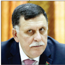
فاویز سراج نخست‌وزیر لیبی

بهبتر است چنین سوالی را از مردم لیبی پرسید. امروز لیبی موقعیت بسیار پیچیده‌ای دارد و زمانی که به ریاست شورای ریاست‌جمهوری این کشور منصوب شدم از هر نظر آماده‌بوم و برای برقراری ثبات در لیبی نیازمند کمک‌های محلی و بین‌المللی هستم.