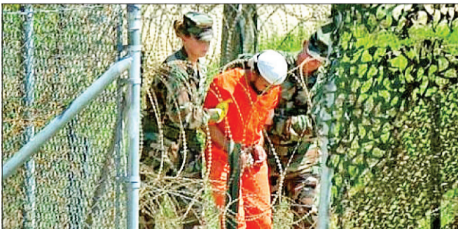
انتقال ۱۵ زندانی گوانتانامو به امارات

در جنوب‌شرقی کوبا نگهداری می‌شدند. با انتقال این ۱۵ نفر، تعداد زندانیان باقی‌مانده به ۶۱ نفر رسیده است. حدود چهارماه تا پایان دوران ریاست‌جمهوری باراک اوپاما باقی‌مانده و او تلاش می‌کند تا قبل از پایان این دوران گوانتانامو را تعطیل کند اما جمهوری خواهان کنگره مهم‌ترین مانع خواهد بود اما این انتقال بزرگ‌ترین انتقال دسته‌جمعی زندانیان گوانتانامو به کشوری ثالث در دوران ریاست‌جمهوری او به شمار می‌آید.