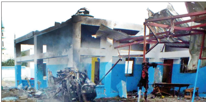
حداقل ۱۱ کشته در حمله به مقر پزشکان بدون مرز در یمن