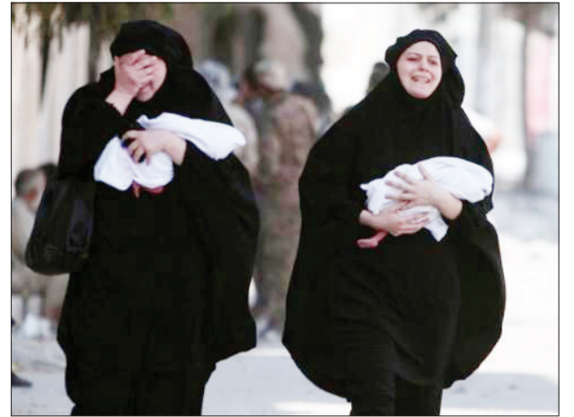
غیرنظامیان آواره از منیج

سخت است تصور کنیم که سرنوشت سوریه در شهرهایی کوچک چون بلک‌پول رقم زده شود، شهرهایی که جمعیتشان بیش از ۱۵۰ هزار نفر هم نیست، اما واقعیت این است، آزادسازی شهرهای کوچک چون منیج سرنوشت سوریه را به شدت تحت تاثیر قرار داد. کمترین نتیجه این پیروزی این است که گروه تروریستی داعش یکی از شاهراه‌های اصلی تحت کنترلش برای انتقال مبارزان و تسلیحات از مرزهای ترکیه را از دست داد، جایی که در ۲۵ کیلومتری سوریه و نزدیک به قلمروی تحت تصرف خلیفه خودخوانده داعش است. در این میان پیروزی نیروهای دموکراتیک سوریه نیز مطمئناً نتایج مثبتی به‌خصوص به لحاظ جغرافیایی به دنبال خواهد داشت. نیروهای دموکراتیک با شورشیانی که حلب را محاصره کردند متفاوتند. شورشیان ساکن حلب معمولاً افراط‌گرا هستند و از حمایت ترکیه و عربستان سعودی برخوردارند. افراط‌گرایان در قالب گروه‌های چون جیش الفتح فعالیت کرده و بیش از هر چیز بر مبارزه با دولت بشار اسد تمرکز کرده‌اند. در مقابل باید گفت که نبرد منیج توسط نیروهای دموکراتیک سوریه (SDF)، رهبری و هدایت شد. مجموعه‌ای متشکل از شبه‌نظامیان عرب و کرد که از حمایت‌های مالی و تسلیحاتی ایالات متحده آمریکا برخوردارند. نیروهای ویژه آمریکا، بریتانیا و فرانسه مطمئناً زمینه را برای آموزش نظامی نیروهای دموکراتیک سوریه فراهم کرده‌اند. روشن است که در کنار گروه‌های تکفیری و تروریستی، گروهی از شورشیان تحت حمایت غرب با دولت سوریه در جبهه‌ای واحد علیه یک هدف مشخص قرار گرفتند، گروه تروریستی داعش.