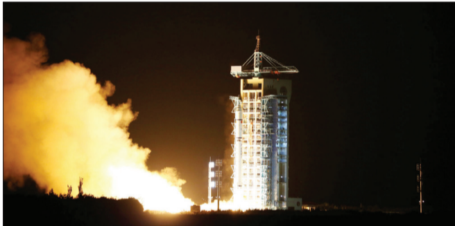
این ماهواره کوانتومی چین غیرقابل هک و شنود است

همه اطلاعات موجود در یک رایانه معمولی را در معرض هک قرار دهد. البته این تنها یک روی سکه است و مکانیک کوانتومی همچنین می‌تواند در نقش محافظ اطلاعات عمل کند. فناوری کلیدی کوانتومی از ایمنی می‌دهد که جنگ سایبری و هک سیستم‌های حساس اطلاعاتی میان چین و آمریکا طی سال‌های اخیر شدت یافته است و دو کشور عملاً در جنگ سایبری قرار دارند. سال گذشته چین آزمایشگاهی برای محاسبات کوانتومی راه‌اندازی کرد. چنین قابلیت محاسباتی قدرتمندی به‌عنوان یک تهدید در نظر گرفته شده، چراکه می‌تواند