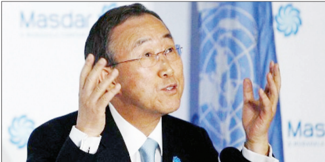
دوران دبیر کلی بان‌کی‌مون در انتهای سال ۲۰۱۶ میلادی به پایان می‌رسد

جانشین بان‌کی‌مون در درجه اول به عهده یک زن جانشینش شود. بان‌کی‌مون که در ۱۵ فوریه در بیان‌سامون ملل است کاندیدای خود برای رهبری سازمان ملل را به مجمع عمومی سازمان ملل متشکل از ۱۹۳ عضو ارائه دهد تا این مجمع کاندیدای معرفی شده را تأیید کند. «پریسا یوگو» دبیرکل کنونی یونسکو، «سنا یوزیک» وزیر امور خارجه کرواسی، «ایگور لاکزیک» وزیر امور خارجه مونته‌نگرو، «سرجان کوریم» وزیر امور خارجه سابق مقدونیه و «دانیلو ترک» رئیس‌جمهوری سابق اسلوانی از جمله کاندیداهای جانشینی بان هستند.