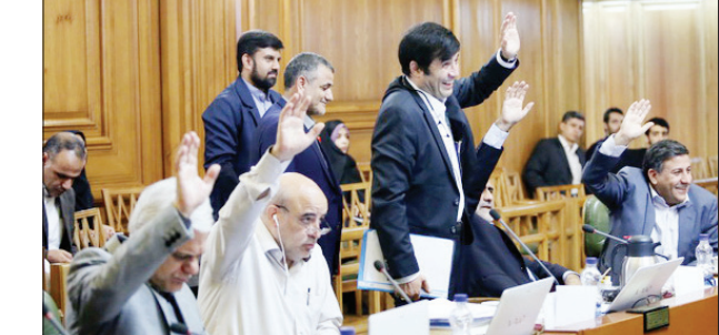
جلسه شورای شهر تهران

انجام به‌موقع پروژه‌های عمرانی و شهری موضوعی است که اهمیت ویژه‌ای برای مدیریت شهری دارد؛ موضوعی که نیازمند انجام مطالعات توجیهی، تعیین مشخصات پروژه، برآورد هزینه‌ها و تنظیم جدول زمان‌بندی است. در این میان این پروژه‌ها باید براساس برنامه توسعه شهرداری و تصمیمات شورای شهر باشد. حالا اما نشان می‌دهد شهرداری تهران برای انجام بسیاری از پروژه‌ها از برنامه عقب است و این موضوع درسروهای فراوانی را برای شهرداری ایجاد کرده است.