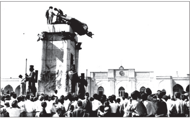
بایین کشیده شدن مجسمه رضاشاه در میدان سپه تهران، ۲۶ مرداد ۱۳۳۲