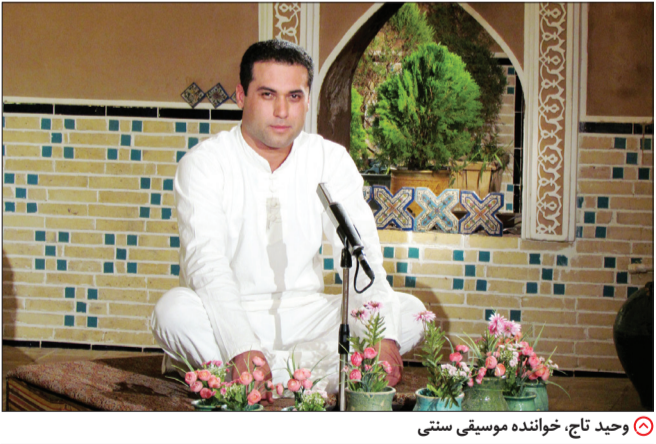
وحید تاج، خواننده موسیقی سنتی

نه اصلا. دلیلی برای این مساله اعلام نمی‌شود، این اتفاقات درحالی در عرصه موسیقی ما بروز یافته که حتی به هنرمندان دلیل لغو و منتفی شدن کنسرت‌ها را ابراز نمی‌کنند. درحالی که هنرمندان برای برگزاری کنسرت‌هایی که در شهرستان‌ها قرار است برپا کنند از ماه‌ها قبل به برنامه‌ریزی می‌پردازند ولی با آنها چنین رفتاری می‌شود. در ارتباط با لغو مجوزها همیشه این سوال برایم مطرح بوده مگر قرار است در یک کنسرت آن