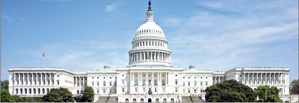
کنگره ایالات متحده آمریکا