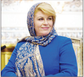
رئیس‌جمهوری کرواسی کولیندا کیتاروویچ