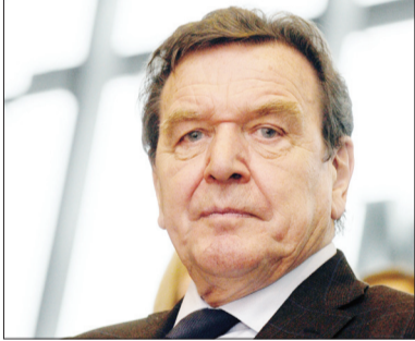
گرهارد شرودر، صدراعظم سابق آلمان

تأثیراتی بر همسایه خود آذربایجان نگذارند. صدر اعظم آلمان که زمانی برای بازسازی و تعمیق رابطه با ایران تردید داشت حالا تنها از برجام حمایت می‌کند بلکه از تحولات مثبت ایران نیز پشتیبانی خواهد کرد. وی در ادامه سخنان خود درباره حل مناقشه قریباغ گفته است که آلمان و آذربایجان هر دو خواستار حل مسالمت‌آمیز بحران قریباغ هستند و برلین نیز به‌عنوان رئیس سازمان همکاری و امنیت اروپا تلاش می‌کند این موضوع حل و فصل شود.