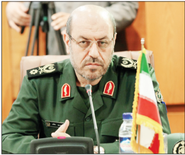
حسین دهقان، وزیر دفاع

نشست کمیته همکاری های ضدتروریستی با حضور نمایندگان ایران، روسیه، سوریه و عراق در تهران برگزار شد.دفتر کمیته همکاری‌های ضدتروریستی در بغداد قرار دارد و از سال ۲۰۱۴ به‌منظور مقابله با تروریسم در منطقه راهاندازی شده است. همکاری‌های چهار کشور در قالب فعالیت‌های مرتبط با این کمیته، همچنین بهره‌گیری