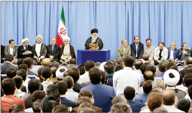
رهبر معظم انقلاب در محفل انس با قرآن

«یکی از کارهای لازم در کشور، رواج جلسات تلاوت و استماع قرآن است.» حضرت آیت‌الله خامنه‌ای افزودند: «همان‌گونه که جلسات عزاداری یا سرور برای اهل بیت علیهم‌السلام برگزار می‌شود، جلسات قرآنی نیز باید گسترش پیدا کند تا سرعت رشد مفاهیم قرآنی افزایش یابد.»