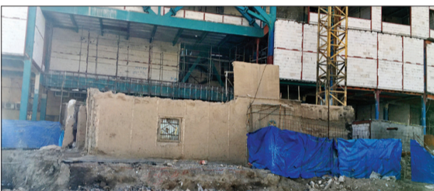
خانه تاریخی امیری در حال بلعیده شدن توسط برج‌ها

منزل تاریخی امیری مربوط به اواخر دوره قاجار است که در ۳۰ تیر ۱۳۸۴ به‌عنوان یکی از آثار ملی ایران به ثبت رسید. این خانه در سال ۱۳۳۰ هجری قمری ساخته شد. مهم‌ترین ویژگی این بنای تاریخی متفاوت بودن توده‌های دو طرف حیاط در ضلع شرقی و غربی از لحاظ ساختار فیزیکی، نوع و میزان تزئینات، نورگیری و ابعاد فضایی است. در دل این ثبت ملی ساختمانی چند طبقه ساخته شده که زیبایی این بنای تاریخی را تحت‌الشعاع قرار داده است. آسمانخراشی که در ضلع شمالی این خانه در حال قد کشیدن است مانند دیوی می‌ماند که در حال بلعیدن این اثر ملی است. دیدن این ساخت‌وساز عظیم در کنار یکی از آثار فاخر ملی هر رهگذری را برای دقایقی میخکوب می‌کند. اما جز آه و آفسوس کاری نمی‌توان کرد و مسیر ادامه دارد.