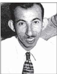
بدر شاکر السیاب

پیامبران شعر نو عرب محسوب می‌شوند. به‌عنوان مثال نازک‌الملک که بر این باور بود که اولین شعرهای نو و آزاد عربی را او سروده است و تمام مخالفت‌هایی که با این گفته او وجود داشت، این حرف‌نشان از آغاز مکتب جدید ادبیات عرب در آثار کسی