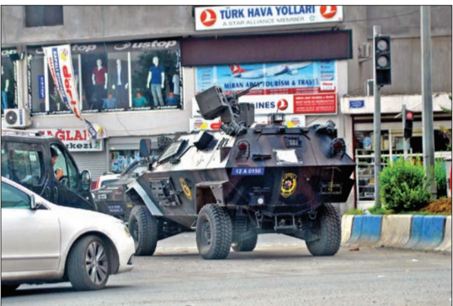
نبرد هوایی نظامی در شهر جیزره

شهر کانون ناآرامی‌ها و اعتراضات ضددولتی کردها بود. دولت ترکیه برای مهار ناآرامی‌های هفته گذشته در این شهر حکومت نظامی اعلام کرد اما از روز شنبه حکومت نظامی لغو شد و بار دیگر استانداری شیرناک بعد از ظهر یکشنبه از ساعت هفت غروب (به وقت محلی) تا هفت صبح دوشنبه در این شهر اعلام حکومت نظامی کرد. شکست حزب عدالت و توسعه در انتخابات هفتم ژوئن و متعاقب آن بی‌نتیجه ماندن تلاش‌ها برای تشکیل دولت ائتلافی، ترکیه را در شرایط دشواری قرار داده است. غالب تحلیلگران و ناظران و احزاب مخالف حکومت ترکیه، انگشت اتهام را به سمت رجب طیب اردوغان، رئیس‌جمهوری ترکیه