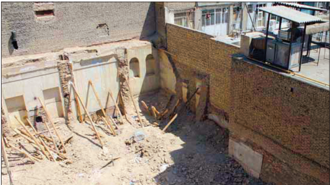
تخریب داخل خانه شبیبانی