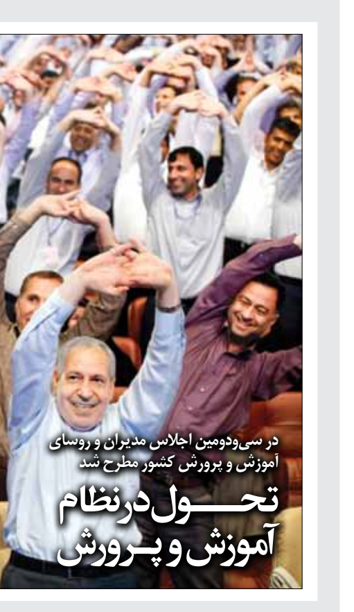
در سی و دومین اجلاس مدیران و روسای آموزش و پرورش کشور مطرح شد

روحانی با چه زبانی سخن گفت؟ نامفهوم بودن و ناشناخته بودن گویش سرخای برای عراقی‌ها و منافقین شتود مکالمات برای آنها را غیر ممکن می‌ساخت و همین عاملی برای پیشتر داهداف عملیات‌ها بود در این سال‌ها و با انتخاب حسن روحانی به ریاست جمهوری کشورمان این گویش کاربرد سیاسی نیز پیدا کرد