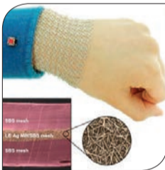
کاف های ساخته شده از توری در جای خود ثابت می ماند و حتی در صورت حرکت مفاصل از خود گرما ساطع می کند.

دانشمندان بر این باورند با وجودی که تاکنون نمونه های مشابهی از این دست ابداع شده، همچنان در فرآیند ساخت از روندی پیچیده استفاده می شود و موادی از قبیل نانولوله های کربنی و طلا در تولید آن به کار می رود. ولی با وجود پیچیده بودن تولید آن، توری ساخته شده باید به راحتی مورد استفاده قرار گیرد و با قیمت مناسبی در اختیار کاربران قرار گیرد. از این نوع توری جدید برای درمان باز توانی استفاده می شود. همچنین از این فناوری می توان در ساخت ژاکت های اسکی یا صندلی های حرارتی خودرو استفاده کرد.