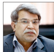
مردم اطمینان می‌دهد که «گرانی ۴۳ درصدی قیمت بنزین تأثیری بر قیمت دیگر کالاها ندارد و تأکید دارد دولت درباره حذف سهمیه‌بندی بین بد و بدتر تصمیم گرفته است.» از سوی دیگر، گویا دولت با موجی از درخواست‌های صنایع و تولیدکنندگان برای افزایش قیمت محصولات خود روبه‌رو است. البته واکنش صنایع و مردم و توضیح دولتی‌ها فقط مربوط به تکنرخی‌شدن بنزین و افزایش قیمت گاز نبود؛ بلکه در بخش هدفمندی یارانه‌ها نیز چنین اتفاقی رخ داد. آنطور که علیرضا صالح معاون سازمان مدیریت و برنامه‌ریزی کشور گفته است «یک سوم میلیارد‌های تهران که یارانه آنها قطع شده یا مراجعه به سازمان هدفمندی یارانه‌ها خواستار دریافت مجدد یارانه شده‌اند، از بیان کرده که «اعتراض‌های زیادی علیه دولت برای حذف عده

معدودی از مردم از دریافت یارانه نقدی شش ماهه، اما دولت تنها یارانه ۵۰ هزار نفر از افرادی در تهران را که درآمد بالا و میلیاردی داشتند، قطع کرده است. بیشتر اعلام شده بود که یارانه نقدی شش ماهیون نفر باید قطع شود. ملاک حذف آنان از فهرست یارانه‌بگیران نیز «خودرو، شغل و ملک» عنوان شده است. برآوردها نشان می‌دهد از ابتدای اجرای هدفمندی یارانه‌ها تاکنون، ۱۸۰ هزار میلیارد تومان هزینه پرداخت یارانه نقدی شده که این میزان معادل کل بودجه عمرانی کشور از سال ۸۵ تا ۹۳ است. آن‌گونه که علیرضا صالح بیان کرده است: «اگر براساس قانون اقدام به توزیع این میزان اعتبار می‌شد حتی با وجود پرداخت نشدن بخش بهداشت و درمان باید ۴۷ هزار میلیارد تومان توزیع می‌شد، این در حالی است که بیش از ۱۳۵ هزار میلیارد تومان از محل فروش حامل‌های انرژی و اجرای هدفمندی یارانه توزیع شده است.» این مقام مسئول آماری را اعلام کرده که نشان می‌دهد، درآمد‌های ناشی از افزایش قیمت حامل‌های انرژی تا تاریخ دوم اردیبهشت ۱۳۹۳ حدود ۱۳۵ هزار میلیارد تومان بوده، در حالی که میزان پرداختی بیش از ۲۰۱ هزار میلیارد تومان بوده است.