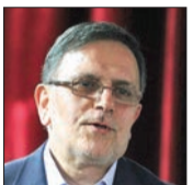
در این تولیدکننده از یک ماده اولیه، با اضافه کردن هزینه، یک کالای جدید تولید می‌کند و از این محل سود می‌برد. اما اقتصاددانان معتقدند میزان ارزش‌افزوده باید با میزان «تورم» بخش مصرف نیز سنجیده شود، آماری که رئیس کل بانک مرکزی ارائه داده، مربوط به ۹ ماه ابتدایی پارسیال است که تورم در ارقام بالای ۲۰ درصد بود. بنابراین اگر نرخ ارزش‌افزوده بخش صنعت، با میزان تورم سنجیده شود، عدد ناچیزی به دست می‌آید که حکایت از رکود شدید در بخش صنعت دارد. شاید به همین دلیل است که نگاه‌های تولیدی، در طول دوره فعالیت خود، دست به فعالیت‌های

رئیس کل بانک مرکزی اعلام کرده که «ارزش‌افزوده بخش صنعت و معدن بدون نفت، از تولید ناخالص داخلی طی ۹ ماه اول پارسیال، به ۲۰٫۷ درصد رسیده است.» ولی‌الله سیف، این رقم را برای ارزش‌افزوده بخش صنعت و معدن، پس از آن اعلام می‌کند که انتقادات زیادی نسبت به رویکرد ضد تورمی دولت و تشدید رکود در اقتصاد ایران، شده است. اما آنچه در اظهارات او به‌عنوان «ارزش‌افزوده» مطرح شده، در ادبیات اقتصادی به «میزان ارزشی گفته می‌شود که در فرآیند تولید به ارزش کالاها و واسطه‌ای افزوده می‌شود.»