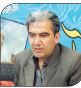
مهبران فرزین دبیر فراکسیون اصناف مجلس