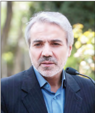
محمد باقر نوبخت

غلامرضا مصباحی‌مقدم، عضو کمیسیون برنامه و بودجه مجلس خواستار توجه هرچه بیشتر به درآمدهای ارزی ناشی از صادرات شد و گفت: «در شرایط فعلی که نرخ نفت رو به کاهش است، باید به صادرات توجه بیشتری شود.» (مهر)