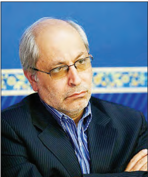
محمد باقر نوبخت