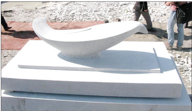
مجسمه شهید که در موزه موسان کره جنوبی نصب شده است

شما در یازدهمین دوره سمپوزیوم موزه موسان کره جنوبی به عنوان نماینده ایران حضور داشتید. این سمپوزیوم چه ویژگی هایی دارد؟ موزه موسان تمایلی دارد از فرهنگ های مختلف اثر داشته باشد و در باغ موزه اش کارهای مختلفی از همه فرهنگ ها دارد. بنابراین هر ساله این سمپوزیوم را برگزار و از سرتاسر دنیا مجسمه سازهایی را دور هم جمع می کند.