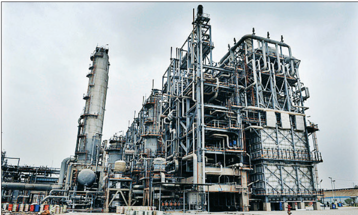
باگذشت ۷ سال از کلنگ‌زنی پروژه انجام شد

عباس کاظمی، معاون وزیر نفت با اشاره به اتمام رسیدن دوره مصرف نفت کوره در نیروگاه‌ها از توقف عرضه این فرآورده‌های نفتی به واحدهای نیروگاهی از سال ۹۳ خبر داد و اعلام کرد: «ظرفیت تولید نفت کوره در پالایشگاه‌ها به حداقل کاهش می‌یابد.» (مه‌ر)