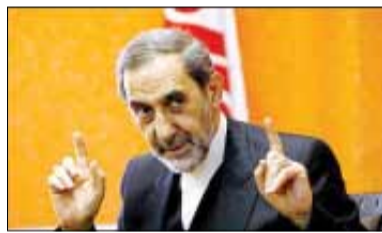
محسن هاشمی تشریح کرد

طرفدار مذاکره است و از اصول خود کوتاه نمی‌آید. رئیس مرکز تحقیقات استراتژیک مجمع تشخیص مصلحت نظام گفت: آنچه در نیویورک انجام شده، مثل گذشته، بوده است. مذاکره‌کنندگان ما که مورد اعتماد رهبر معظم انقلاب و ملت ایران هستند بر مواضع حقه ایران تأکید کرده‌اند. اینکه آنها (طرف مقابل ایران) تصور کنند با فشار اقتصادی و کش‌دادن مذاکرات می‌توانند ایران را وادار به عقب‌نشینی از مواضع و اصول حقه خود کنند، خیال خامی بیش نیست. ولایتی افزود: «محمدجواد ظریف وزیر امور خارجه هفته آینده در مذاکرات ایران و گروه ۵+۱ شرکت خواهد کرد که امیدواریم با حفظ اصول جمهوری اسلامی ایران که توسط رهبر معظم انقلاب ترسیم شده است بتوانیم مذاکرات را به پیش ببریم ولو اینکه طولانی شود.»