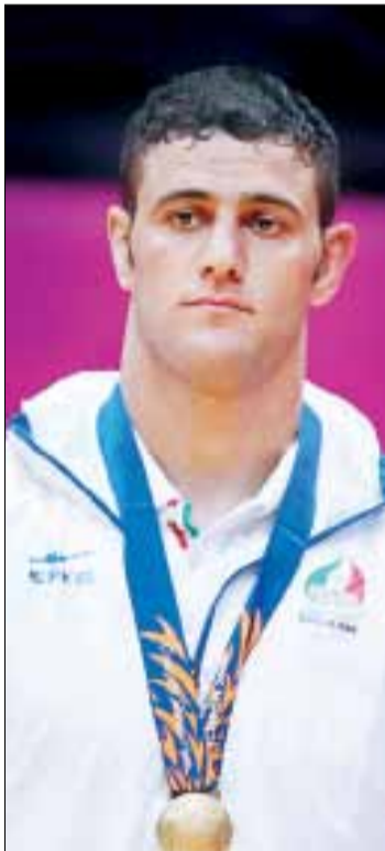
محسن هاشمی تشریح کرد