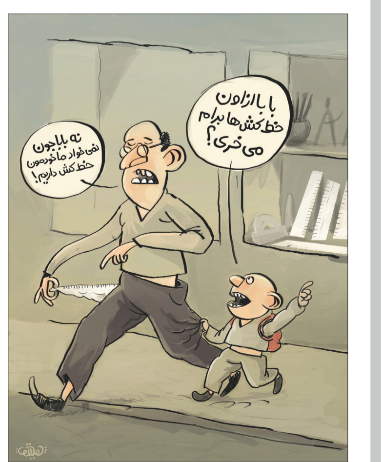
حباب خال خط کشی شده